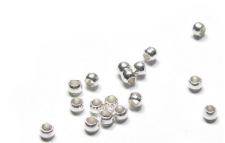
Perles de sertissage Remplacent les nœuds sur le fil nylon