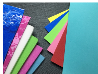
Mousse EVA Epaisseur 2mm